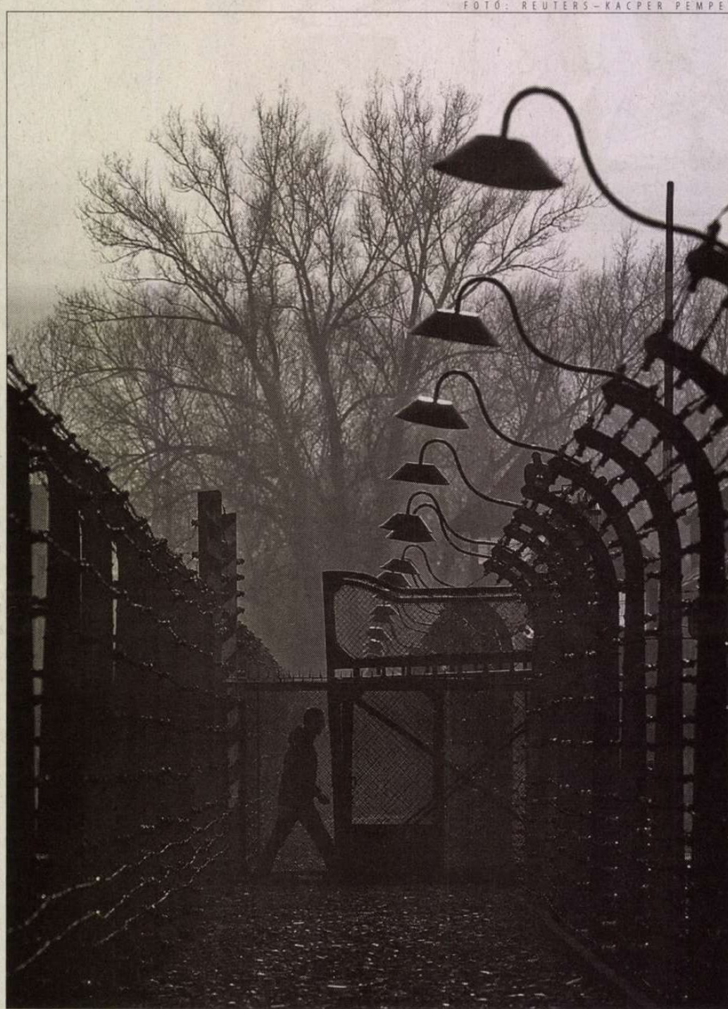
Látogató az auschwitzi emlékhelyen. Nincs konszenzus a tilalmi törvényekről

Az említett Jürgen Graf igen termékeny holokauszttagadó történész, egy időben szinte évente jelent meg kötete. Néhány esztendeje egy internetes oldalon Ungváry Krisztiánnal is vitát folytatott a véskorszokról. A